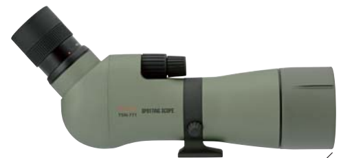
TSN-771 Hochwertige Normallinse Schräger Einblick

**Das Spektiv ist nicht für die dauerhafte Anwendung unter Wasser geeignet.