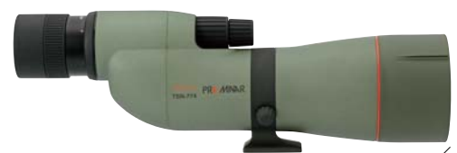
TSN-774 PROMINAR XD-Linse Gerader Einblick