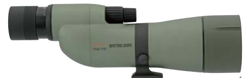
TSN-772 Hochwertige Normallinse Gerader Einblick