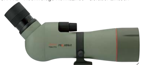
TSN-773 PROMINAR XD-Linse Schräger Einblick